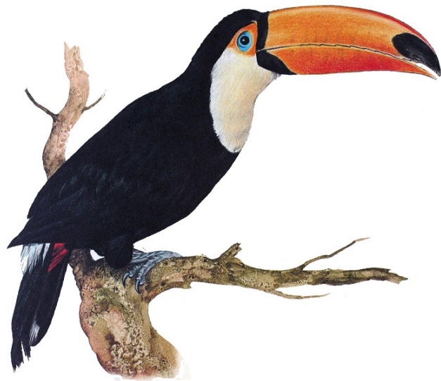
VEREIN FÜR ARTENSCHUTZ VOGELHALTUNG UND ZUCHT E.V. MITGLIED IM BNA, AZ UND DKB