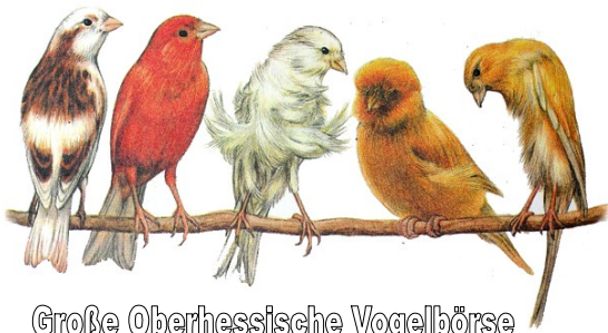
Große Oberhessische Vogelbörse

Der Verein bietet seinen Züchtern jährlich eine Prämierung der Nachzuchten. Um das Hobby der Bevölkerung näher zu bringen werden regelmäßig Vogelschauen veranstaltet. Weiterhin stellen die Züchter des Vereins auf Verbands-, Landes- und Bundesschauen aus. Dabei konnten Züchter der Vogelfreunde Lollar u. Umgebung e.V. bereits Titel wie Bundessieger, Bundesgruppensieger, Landessieger, Landesgruppensieger und Verbandsmeister erringen. Besonders erwähnenswert ist, dass die Erfolge in allen Sparten erzielt werden.