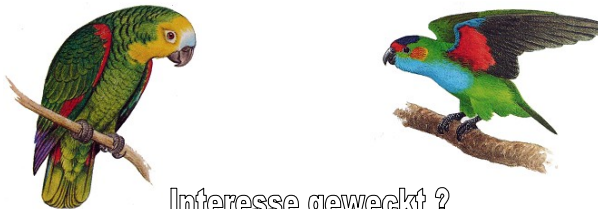
Interesse geweckt ?

Jugendarbeit : Ein dem Vorstand angehörender Jugendwart betreut die Jugendgruppe des Vereins. Der Jugendwart ist hierbei insbesondere Ansprechpartner der Jungzüchter, um auf deren spezielle Probleme einzugehen und Kontakte bzw. Verbindungen zu den "alten Hasen" herzustellen.